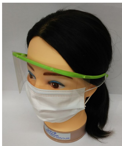
マネキン